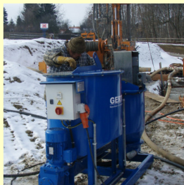
Construction de puits