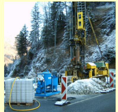
Travaux spéciaux de génie civil Construction de tunnels